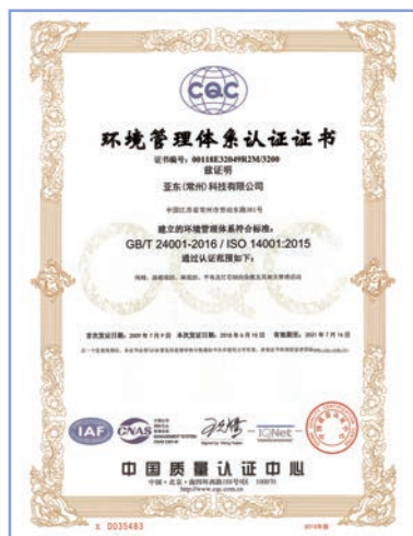
亞東常州環境管理體系認證證書

本集團嚴格遵守《中華人民共和國環境保護法》、《中華人民共和國環境保護稅法》等國家和地方的法律法規，持續建立健全環保工作標準與制度，將綠色發展理念貫穿整個生產運營過程中。亞東常州制定並完善了《環境保護管理制度》，明確了不同部門以及各層級負責人員的工作職責，進一步細化環境保護重點工作，提升排放物及能耗管理的能力與表現，致力於不斷降低運營及辦公活動對環境的影響。亞東常州參照《排污單位自行監測技術指南總則》HJ 819-2017制定了污染源監測方案，對生產過程中所產生的廢氣、廢水排放設置監測點，嚴格執行監測方案並確保監測質量。同時，本集團建立並維持了符合環境管理體系認證證書(GB/T 24001-2016以及ISO 14001:2015)標準認證的環境管理體系，入選國家級綠色工廠名單。