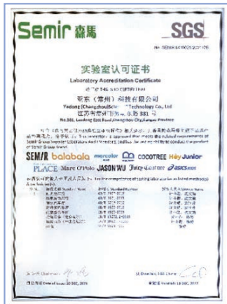
森馬實驗室認可證書

本報告期，亞東常州在紡織品耐光色牢度、耐皂洗色牢度、耐水色牢度以及接縫滑移等方面的檢查中都表現優異，從而獲得了合作服裝製造商實驗室的認可證書等榮譽。除此之外，亞東常州依然於本報告期內對客戶滿意度進行了調查，從質量、價格、交貨、服務四個維度了解客戶對公司的滿意程度及意見與建議，共計10家企業參加了調查，最終滿意度得分為97分/100分。