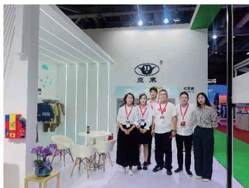
上海秋冬面料展會

本集團格外重視產品和技術的研發創新。為了打造產品的特色，拓展產品的業務範圍和領域，亞東常州在多纖維混紡面料的開發上不斷突破瓶頸。本報告期內，在紡織產品激勵的競爭下，亞東常州依然取得了483個樣品種類，以及1,691色色位，可肯測試進行了1,562塊樣品，均創下了本集團的歷史新高。本年度，亞東常州優秀的創新產品獲得了市場與行業的認可，曾受邀參加上海秋冬面料展會。