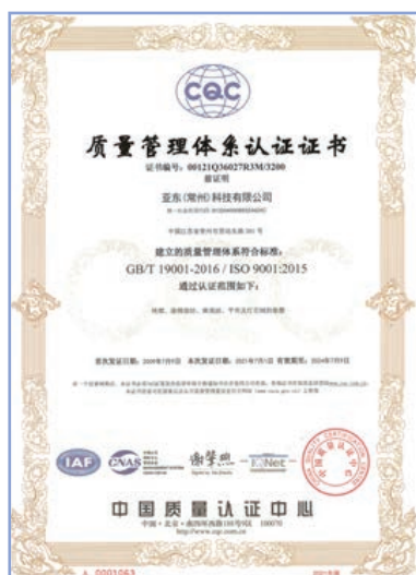
亞東常州質量管理體系認證證書

本集團堅信好的坯布是染廠保證產品質量的前提，因此工廠通過加強來坯的檢驗工作以踐行產品高標準生產。亞東常州要求在崗人員堅守「規範、標準、公開、透明」的八字方針，同時於內部制定《質量管理制度》並實施必要控制措施以嚴格管控進出廠的產品質量，從原料的採購、生產流程、生產工藝、到最終成品以及包裝的各個環節都進行了嚴密的設置和把控，並獲得了質量管理體系認證證書(GB/T 19001-2016以及ISO 9001: 2015)質量管理體系認證。