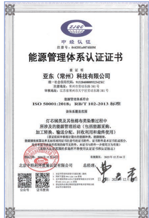
亞東常州能源管理體系認證證書

在蒸汽和天然氣管理方面，本集團規定對重點用能設備必須安裝計量裝置，每月按慣例檢查裝置是否正常運轉，保證計量的時效性與準確性。同時，做好蒸汽管線和燃氣管道的日常維護和檢修工作，盡可能的減少不必要的蒸汽熱量損失，排查任何潛在的燃氣安全隱患。