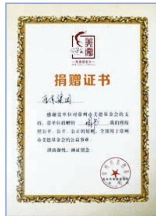
榮獲美德基金會證書