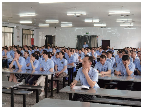
化學品員工培訓活動