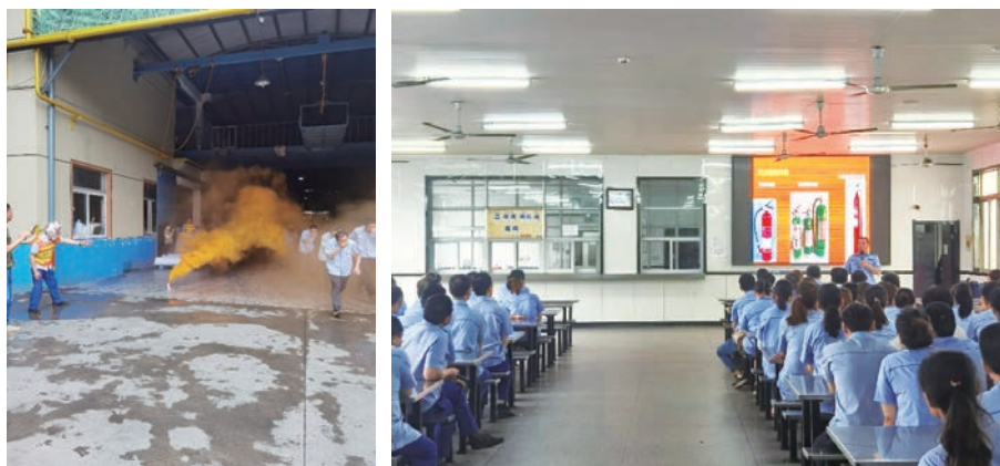
亞東常州開展消防應急演練活動

本集團組織開展了各類安全教育培訓活動，包括綜合應急預案演練、車間火災現場處置方案演練、觸電事故現場處置方案演練和機械傷害現場處置方案演練，通過一系列演練活動有效增強員工們應對突發事件的能力，提高整體安全意識。本報告期內，亞東常州在職業健康與安全方面投入的資金約為190萬元，共有482人次參加了本年度的相關培訓活動，每名員工的平均培訓時長為12小時，健康安全培訓總時長為5,784小時。