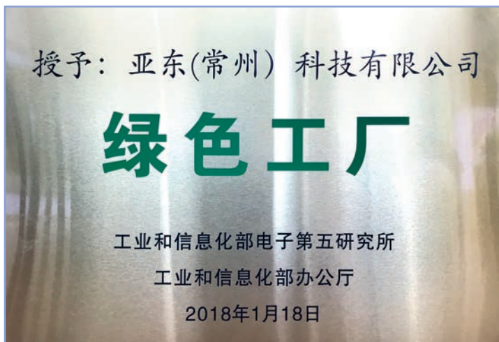
亞東常州國家級綠色工廠標牌