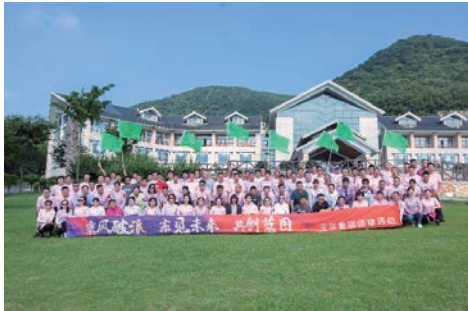
開展戶外拓展訓練