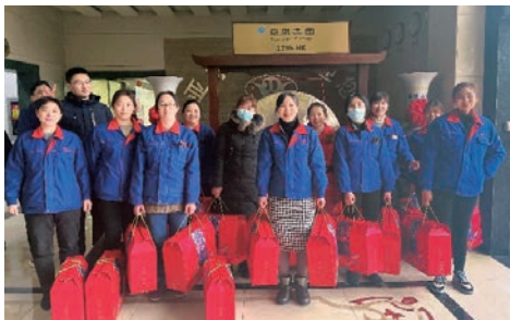
為員工發放過年大禮包