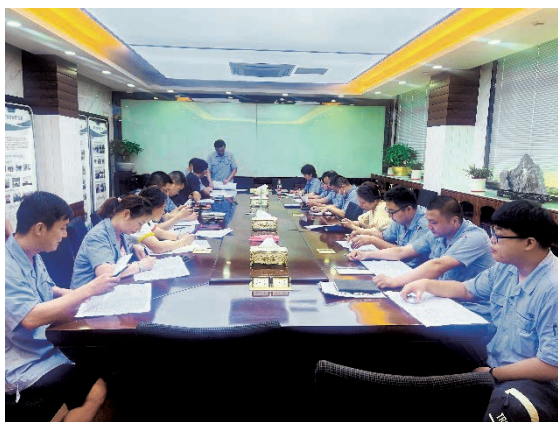
業務員內部學習培訓

為進一步提高未來的生產效率與產品質量，亞東常州將加強技術崗位及業務人員培訓，提高各項測試技能，增加檢測設備和測試項目，穩定測試手法，提高各項數據的準確性，加快判定產品合格速度。同時，加強整體部門人員管理，每季度進行一次技術以及相關業務技能知識的培訓。加強現場管理，減少人為差錯，保持現場整潔，規範，提高整體綜合水平。