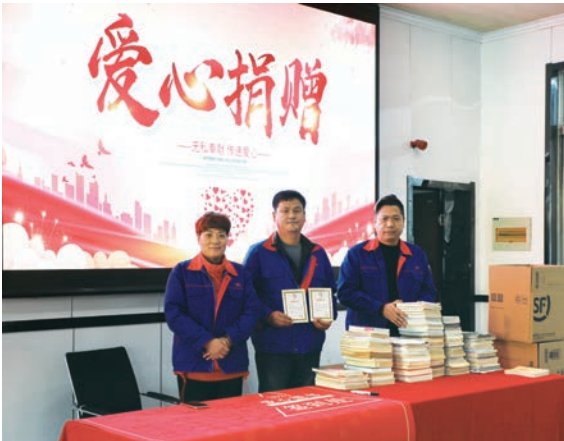
亞東常州舉辦愛心捐書活動

為提升員工的社會責任感，號召更多的員工參與志願活動，關注兒童教育成長，本集團組織員工舉辦愛心捐書公益活動，在中國郵政的協助下運送書籍，為貧困山區的孩子送去精神食糧，充實豐富孩子們的生活，捐贈了價值3,000餘元的書籍。同時，為山區居民提供便民服務，如協助換駕照、代繳水電煤氣費、代發養老金等。