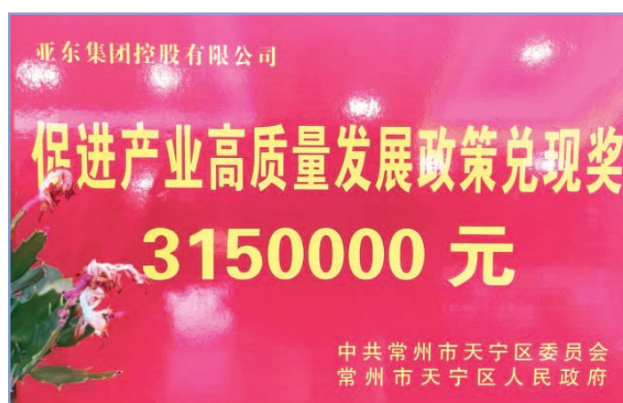
榮獲促進產業高質量發展政策兌現獎

亞東常州制定了銷售退回管理制度，公司的銷售退回須經銷售部長、分管副總審批後進行。在確認接收客戶提出的退貨要求時，經辦業務員需要填寫「質量處理報告」，質檢部對退回的貨物進行質量檢查並在「質量處理報告」上填寫質檢部意見，倉庫保管員清點退回貨物數量並開具「退貨返修單」後交由財務部登記，財務部應當對「質量處理報告」「質量處理報告」和退貨方出具的退貨憑證等進行審核後辦理相應的賬務處理。而後公司對退貨原因進行分析後明確有關部門人員的責任。本報告期，未發生因產品健康與安全原因發生的召回事件。