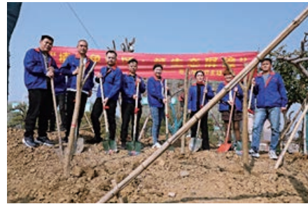
組織員工舉辦植樹節主題活動